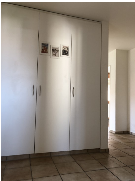
Vorraum mit Einbauschränken