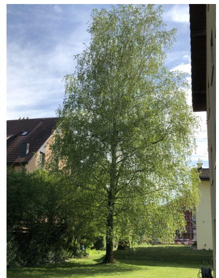
Umgebung (für Eigentümerinnen und Eigentümer nutzbar)